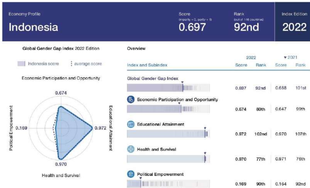
Gambar 1.1 Indonesia Global Gender Gap Index 2022